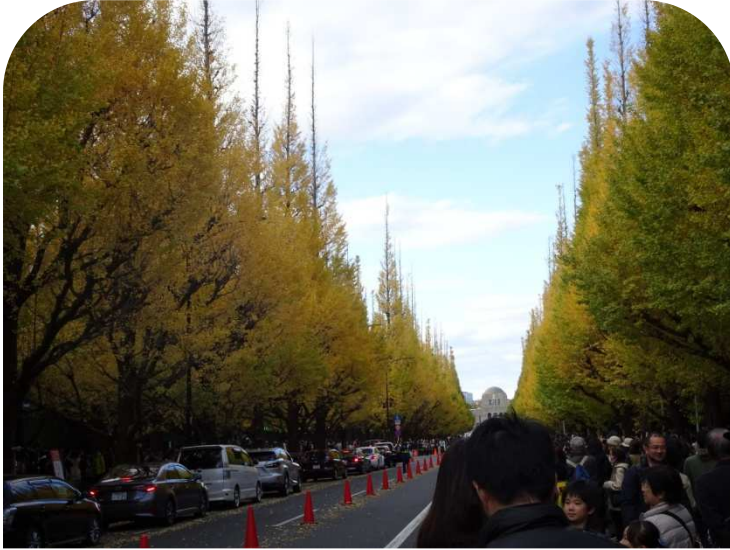
よく出て来る光景、青山通りから絵画館に向かって!

毎年この時期に通って 15 年になります、イチョウの葉の変化具合も毎年変わります。今年は台風の影響(塩害)もあり綺麗な黄葉になる前に枯れた葉も多く少し残念です。見学の人出は外国からの訪問者も年々増加し、休日はこの有様です。同時期に開催の“神宮いちよう祭り”<絵画館前広場>も、日本各地からの出展(名物食)が増え盛大になって来ています。近郊の皆さんも散歩がてらに、足を運んだら如何でしょう?(12月上旬まで)