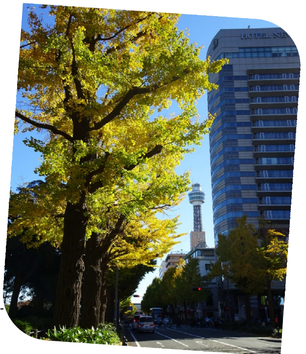
山下公園名物 「横浜マリンタワー」