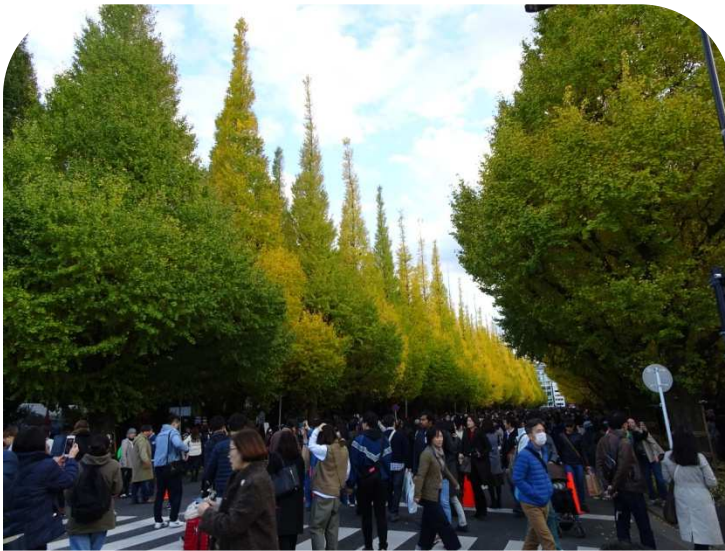
絵画館側から青山通り方面、まだ青葉が目立つ