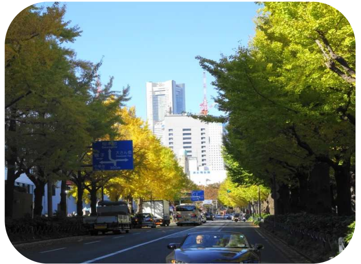
山下公園通りの先にランドマークタワー