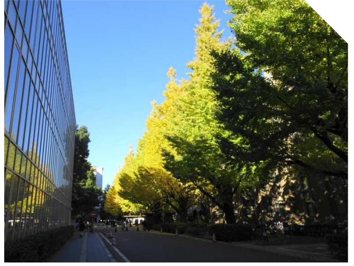
キャンパス内には至る所にイチヨウ並木が