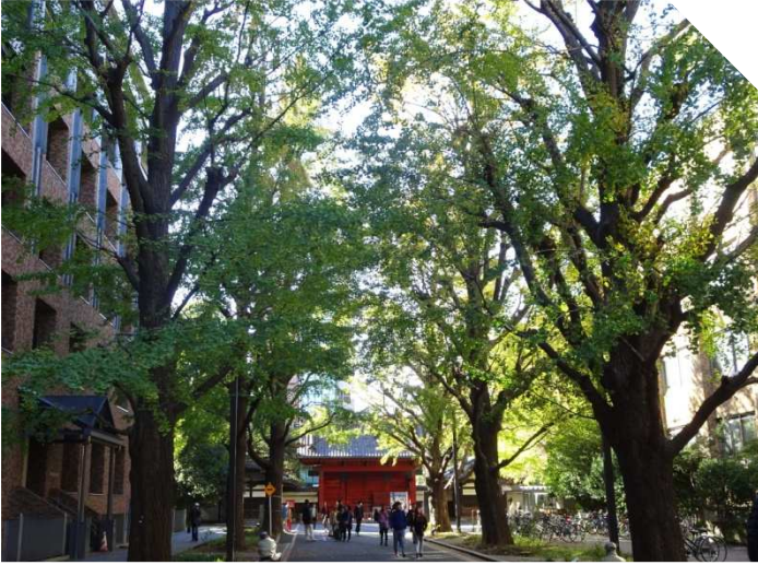
本郷キャンパス内より 赤門を望む