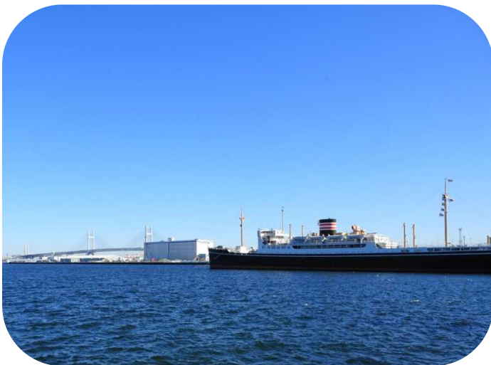
山下公園から氷川丸とベイブリッジ(左奥)