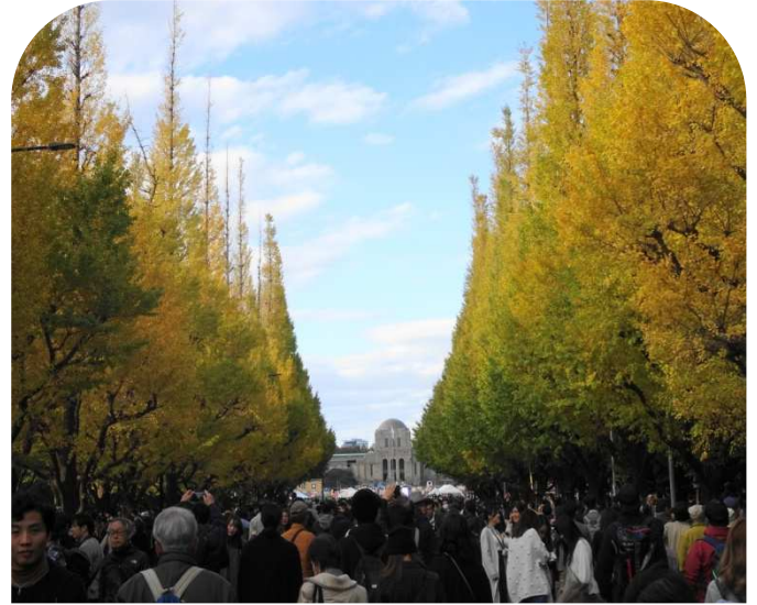
奥に見えるのが絵画館(通いの途中から歩行者天国)