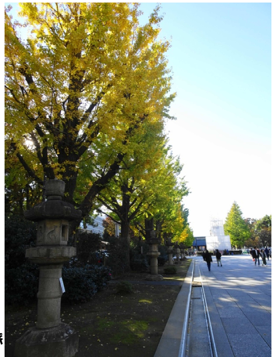
参道の燈籠は立派