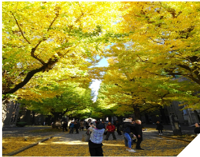
多くの見学者が構内に 外人が多くビックリ!