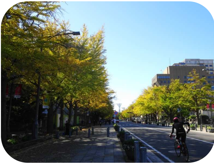
日本大通りから横浜スタジアム方面を望む