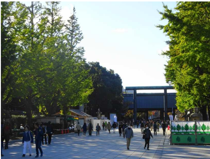
未だ青葉が目立ち少し早い黄葉でした